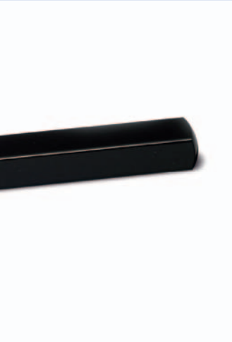
Kunststoffbauteil, das durch das polierte Spritz- gusswerkzeug effektiver entformt werden kann.