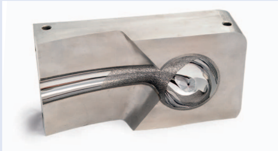
Polierte und strukturierte Form für einen Duschkopf